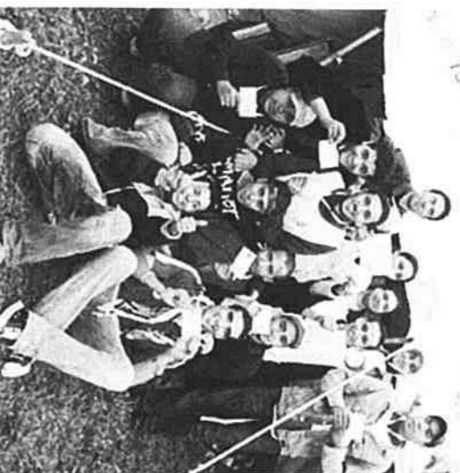
公園にテントを張り、キャンプなどを行う若者センターのピアニスターたち